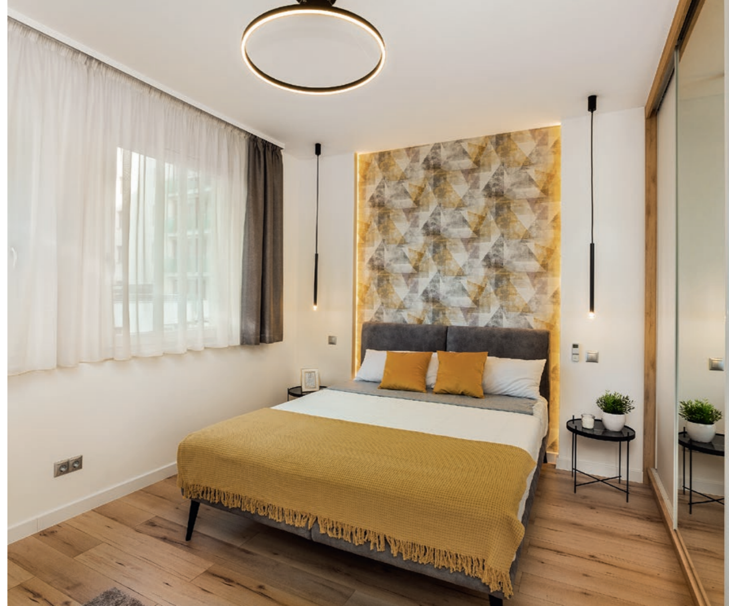
A berendezés során egységes színharmóniájú, fiatalos, szerethető otthon létrehozására törekedtek.